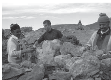
Aménagement d'un point d'apport pour déchets à Tagmoute