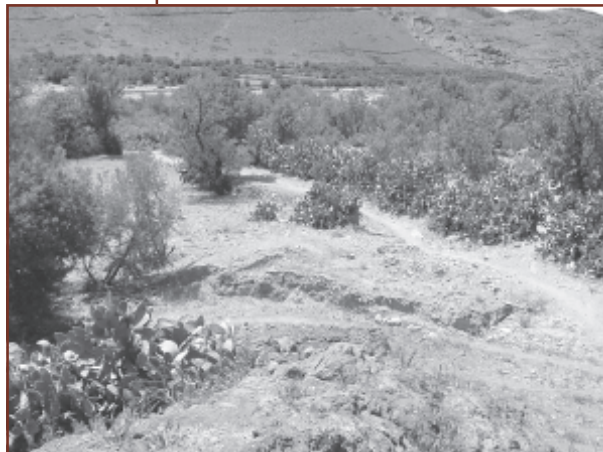
Photo du site retenu pour l'implantation de l'unité de traitement des eaux usées.