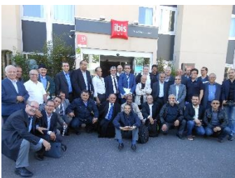
Réunion MRE Tiznit 11 mai 2015 - Paris