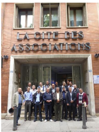
Visites Croisées - délégation Agriculture Familiale du 3 au 10 mai 2015

En tant qu'Opérateur d'Appui pour le dispositif de financement PRA/OSIM 2015 , du FORIM, M&D a accompagné des associations dans le montage de leur projet et tient à féliciter l'association KHAMSA qui a obtenu une subvention pour son projet « Accompagnement des associations de la province de Sidi Kacem pour la remise à niveau des établissements de protection sociale, au Maroc ». Une formation au montage de projets a été organisée le 19 septembre 2015, à Aubervilliers.