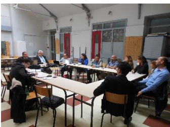
Réunion MRE Siroua 16 mai 2015 - Paris