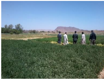
Mission Agriculture Avril 2015 - Maroc