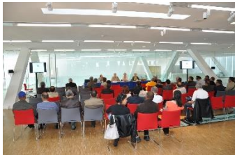
AG de M&D 9 mai 2015 - Marseille

Des séances de sensibilisation sur l'environnement ont eu lieu dans les communes rurales d'Assaka et Agadir Melloul. Au total, ce sont 179 villageois(e)s et enfants qui ont été sensibilisés à la gestion de l'eau et des déchets solides.