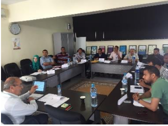
Formation Droits des migrants, 22 – 24 mai 2015, Agadir