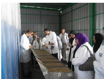
Visite de la COPAC Juin 2015 - Agadir