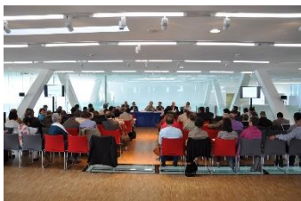
Séminaire sur l'Agriculture Familiale 8 mai 2015 - Marseille