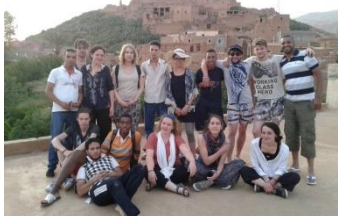
Chantiers Echanges Juin 2015 - Maroc