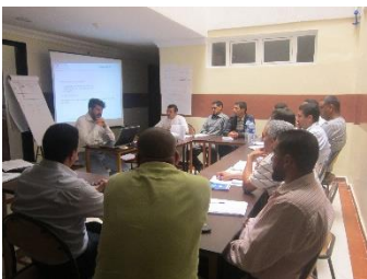
Formation Accompagnement à l'investissement, 17 juin 2015 - Agadir