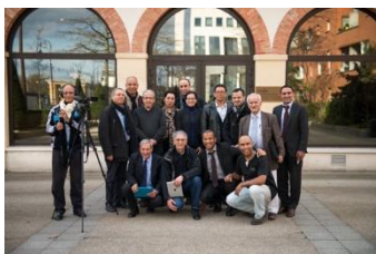
Constitution CAD Oriental - 28 mars 2015 - Gennevilliers

Retrouvez les comptes rendus de ces réunions et photos.