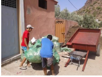
Journée de la propreté Juillet 2015 - Idergane

Cette formation s'inscrit dans la continuité des précédentes sessions organisées sur la broderie.