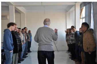
Séminaire interne entre salariés février 2015, Tiznit

N'hésitez pas à nous suivre et nous contacter sur les réseaux sociaux !